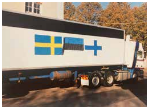
Lastbil med försedd med Estniska, Finska och Svenska flaggor.

Vi mottogs med öppna armar. Vi hade fått tillsägelse att inte ha radioutrustningen påslagen i Finland. Men det var inget problem. Kollegan sade ”kör igång kommunikationen, jag meddelar televerket att det kommer att pratas svenska på kanalen”.