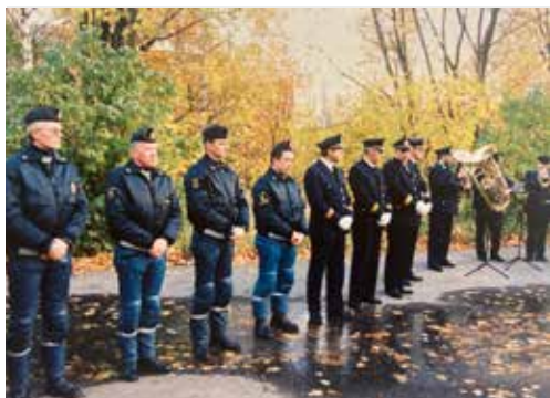
Avsked i Åbo, tyst minut innan avfärd.