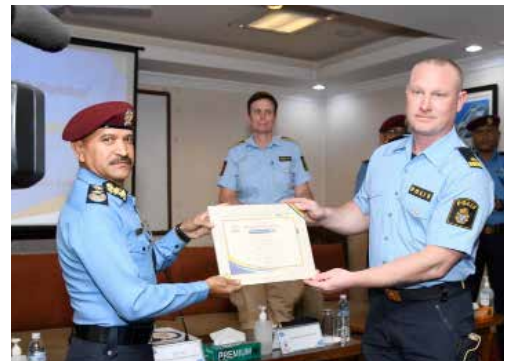
Inspector General police (motsv. rikspolischef) Nepal överräcker ett diplom som erkännande för god utbildningsinsats.