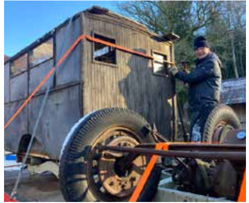
Anders Granath spänner sig.

På grund av den isärplockade bilen blev det mycket fundering om vilka delar som tillhörde "vår" bil och vilka delar som var till flera andra isärplockade bilar som säljaren hade