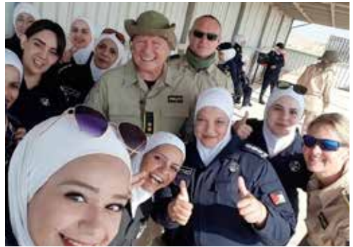
Ett glatt gäng kollegor i Jordanien.

perspektiv på tillvaron och polislivet i Sverige. Komplet artikel går att läsa på hemsidan.