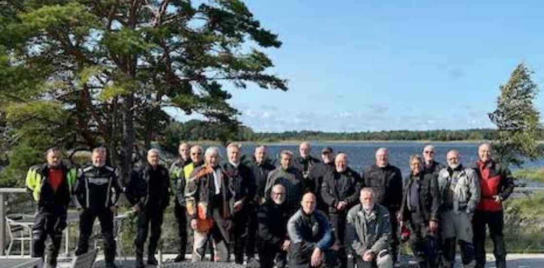
Fotot avser gruppbild från Värmlandsnäs.