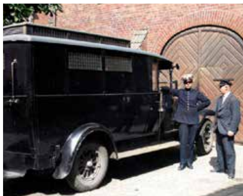
Målbild för renoveringen.

VI SAKNAR FORTFARANDE MÅNGA AV ERA MAILADRESSER