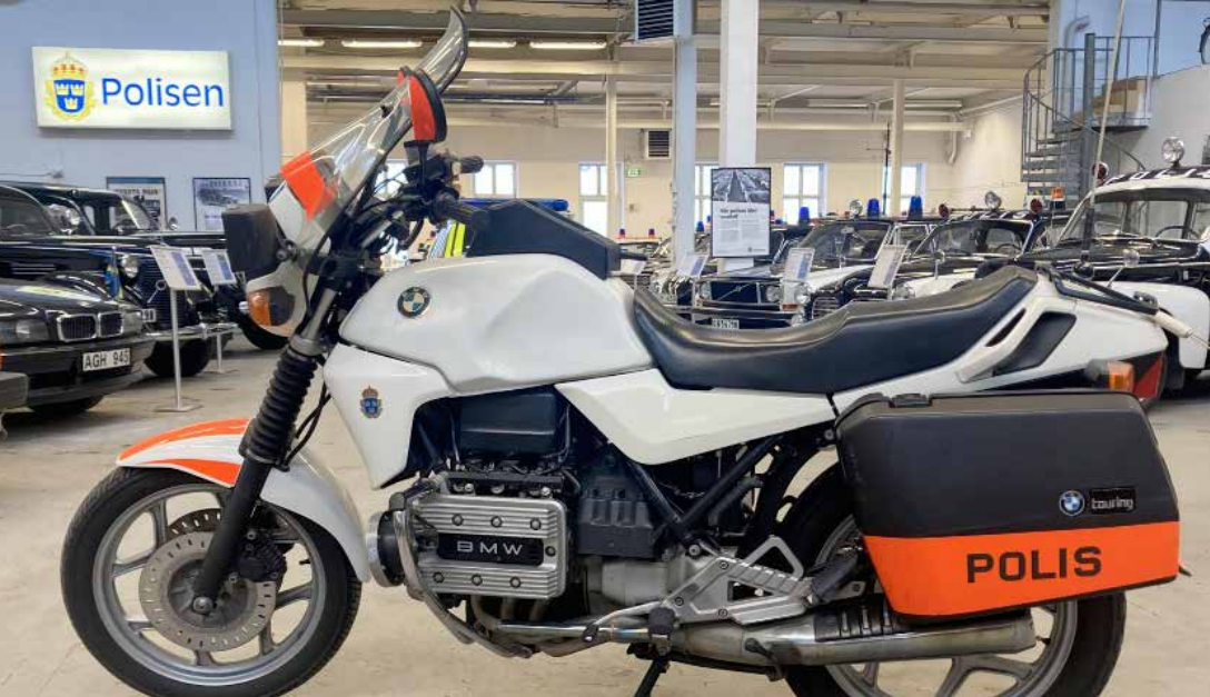
BMW K75 årsmodell 1986