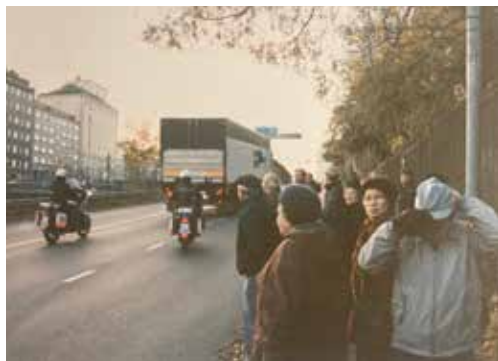
Avfärd från Åbo.

Vi var frusna och jag föreslog att få tillgång till bastu. Direkt kom svaret, ”dom är bokade för er”. Det som kännetecknade all kontakt med våra finska kollegor var en öppenhet, värme och att allt gick att ordna.