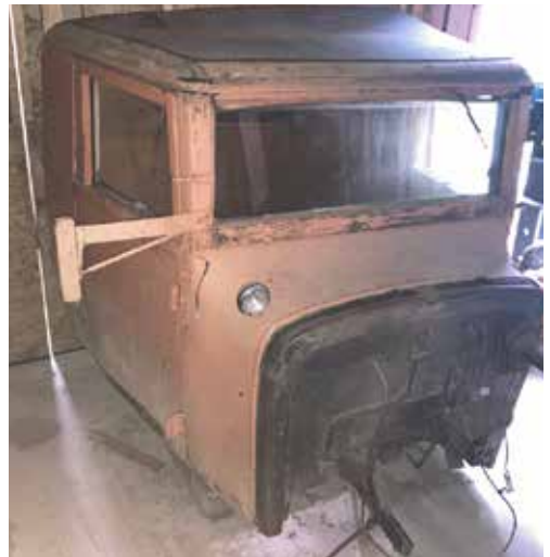
Fordomshytt under renovering.