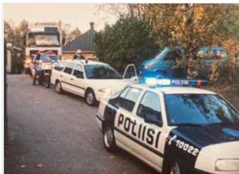
Uppställning vid avfärd.

Snabbt togs ett beslut om att resan över till Sverige, skulle gå med Sea Wind, från Åbo. Det blev en resa på knappt 20 mil. Det var sent på eftermiddagen och det var kylslaget och temperaturen skulle falla. Min finska kontaktkollega frågade om vi ville köra ”non Stop”. Med tanke på kylan så önskade jag ett stopp ungefär halvvägs. Direkt föreslog han Lahanajärvi, ett ortsnamn som finns i min hemtrakt. Vid ankomsten dit visade det sig vara en vägkrog. Den var helt tömd på civila och det var en stor mängd finska poliser där. I restaurangen var det uppdukad med förtäring och vi kände oss välkomna och värmen spred sig. När vi var klara för avfärd, frågade jag kollegan hur vi skulle betala. Han tittade förvånat på mig och sade ”nej fan, det här betalar presidenten”. När vi närmade oss Åbo, var sista delen avstängd för övrig trafik och gatorna var kantade av tända marschaller. Det kändes stort och värmande. När vi anlände hamnen möttes vi av företrädare för rederiet. Vi fick en fråga om det var något speciellt vi önskade.